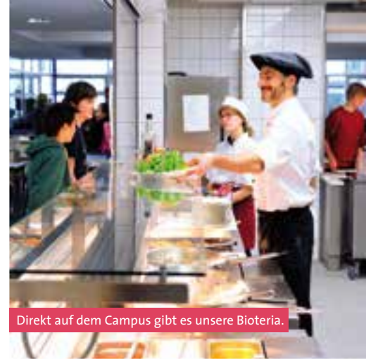
Direkt auf dem Campus gibt es unsere Bioteria.