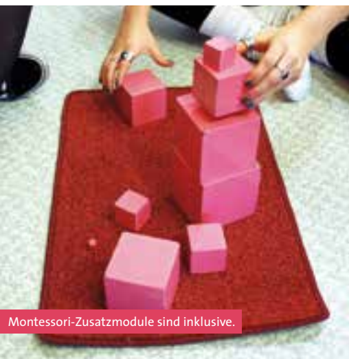
Montessori-Zusatzmodule sind inklusive.