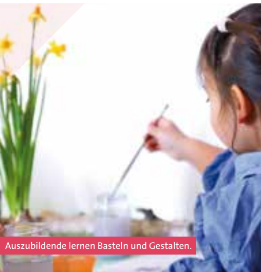
Auszubildende lernen Basteln und Gestalten.