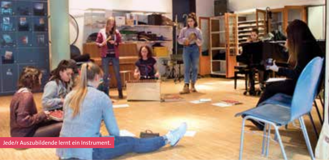
Jede/r Auszubildende lernt ein Instrument.