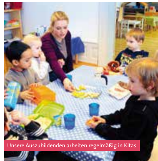
Unsere Auszubildenden arbeiten regelmäßig in Kitas.